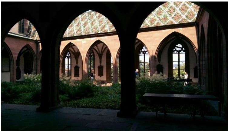
Afb. 4 (Pee Groothuizen): in het Munster.

De achterliggende reden: Veel Nederlandse delegatieleden waren teleurgesteld in het aanbod aan excursies en bedrijfsbezoeken tijdens de Europese Conferentie in Bazel, die alleen tegen bijbetaling van tientallen euro's konden worden geboekt. En wegens gebrek aan inschrijvingen werden er ook nog eens veel geannuleerd. Wij hebben het initiatief genomen tot een (gratis) alternatieve stadswandeling met aansluitend een diner op eigen kosten.