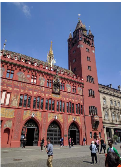
Afb.5 : het Raadhuis.