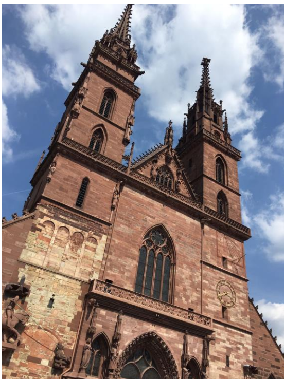
Afb. 3 (Peter Snel): het Munster. Met de torens Rudolphus en Timotheus... of heten ze anders?