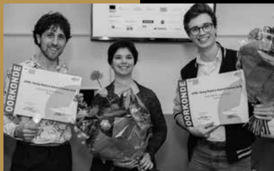
Finalisten AYMA Picoo (L), Somnox (R)

Somnox is 's werelds eerste slaaprobot die wetenschappelijk bewezen cognitieve en gesimuleerde menselijke ademhalingstechnieken gebruikt om sneller in slaap te vallen. Alles over slaap weten is interessant, en er zijn genoeg apps die helpen bij het volgen van je slaaproces, maar het is tijd voor een apparaat als Somnox dat echt iets dóet om je te helpen in slaap te vallen. Het is het ultieme maatje voor mensen die sneller in slaap willen vallen, langer willen slapen en uitgerust wakker willen worden.